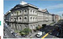
Università degli studi di Napoli Federico II Sede Centrale - Corso Umberto I, 40