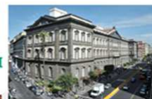
Università degli studi di Napoli Federico II Sede Centrale - Corso Umberto I, 40